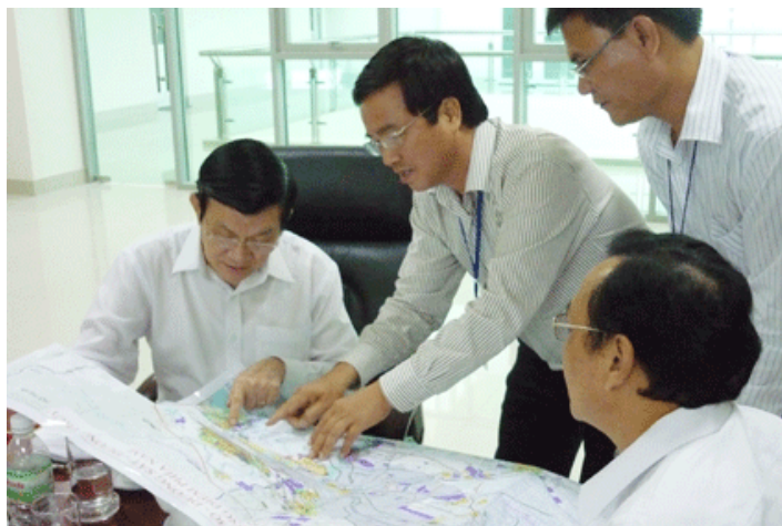
Chủ tịch nước Trương Tấn Sang (thứ nhất, bên trái) nghe báo cáo về quy hoạch các tuyến đường giao thông huyết mạch để phát triển hệ thống cảng biển Cái Mép - Thị Vải.

Chủ tịch nước đánh giá cao sự nỗ lực của các doanh nghiệp đã đóng góp vào sự tăng trưởng của cả nước nói chung và tỉnh BR-VT nói riêng, đồng thời chia sẻ những khó khăn và ghi nhận những ý kiến, kiến nghị của doanh nghiệp. Chủ tịch nước nhấn mạnh, Chính phủ đang làm hết sức mình để tháo gỡ những khó khăn, vướng mắc cho các doanh nghiệp, các nhà đầu tư trong và ngoài nước; Tiếp tục tạo môi trường pháp lý, môi trường xã hội, môi trường cạnh tranh lành mạnh ngày càng tốt hơn để các doanh nghiệp có nhiều cơ hội phát triển bình đẳng, đóng góp cho công cuộc xây dựng đất nước.